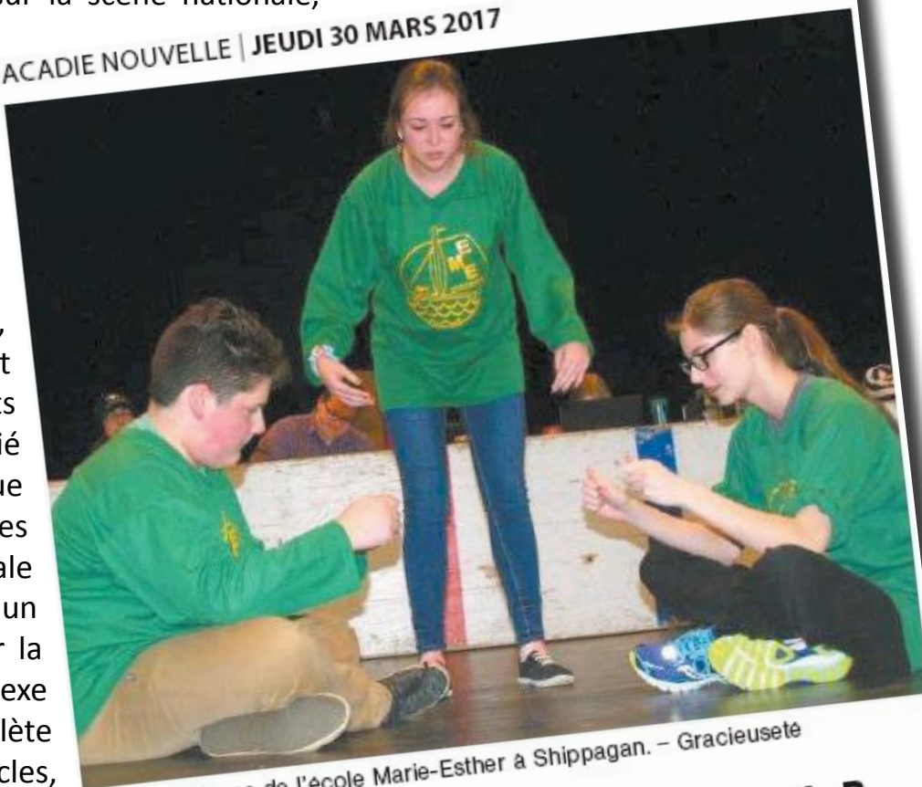
L'équipe hôte de l'école Marie-Esther à Shippagan.