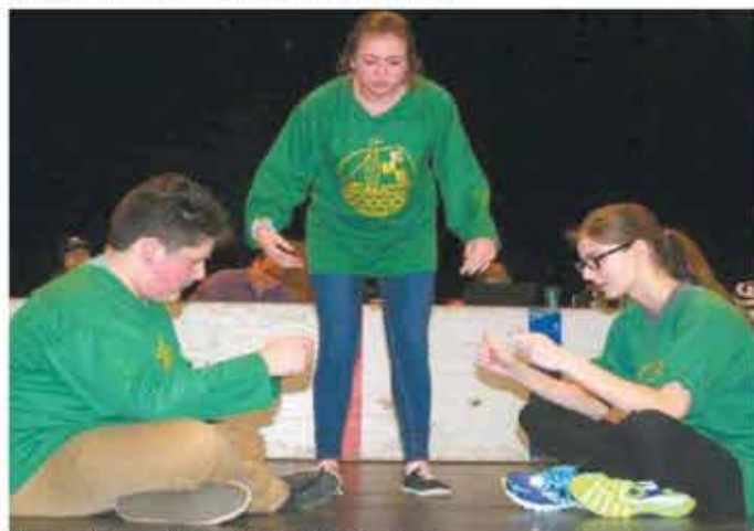
L'équipe hôte de l'école Marie-Esther à Shippagan.